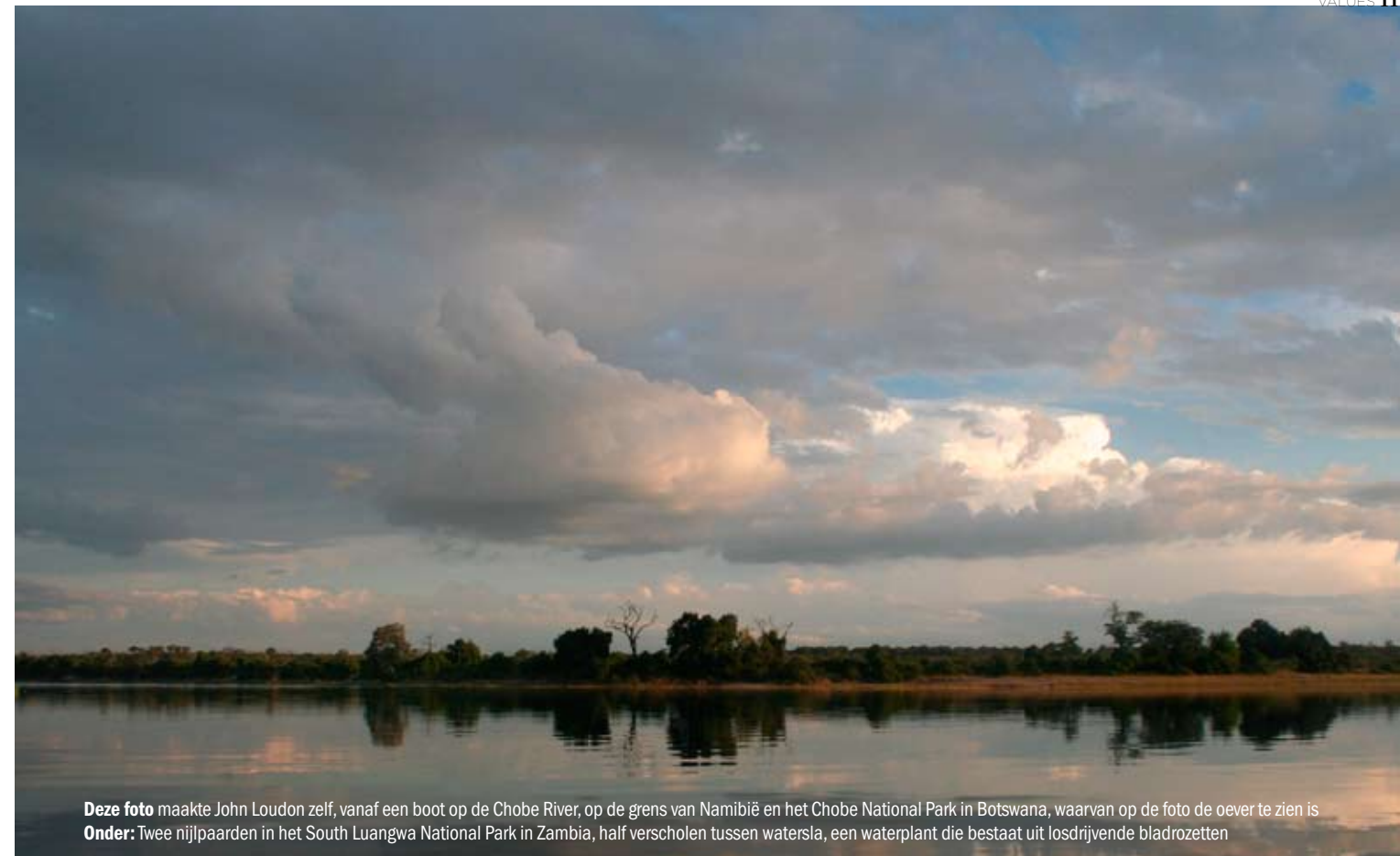
Deze foto maakte John Loudon zelf, vanaf een boot op de Chobe River, op de grens van Namibië en het Chobe National Park in Botswana, waarvan op de foto de oever te zien is Onder: Twee nijlpaarden in het South Luangwa National Park in Zambia, half verscholen tussen watersla, een waterplant die bestaat uit losdrijvende bladrozetten

Bij de start van zijn onderneming, die zijn initialen JL draagt, had